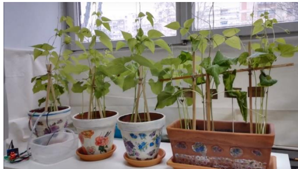
Slika 2: Stabiljke graha

Zbog brzog rasta graha, uz pomoć školskog domara intervenirali smo i postaviti mu dodatnu potporu. S biljkama koje su ručno zalijevane nije bilo nikakvih poteškoća i projekt se odlično odvijao. Tim koji je motrio Micro:bit nije imao toliko sreće jer je u nekoliko navrata zakazala tehnologija. Prvobitni problem je nastao zbog nepravilnog programiranja Micro:bita. Trebalo je postaviti prave parametre za zalijevanje kako biljka ne bi bila previše ili premalo zalijevana. Taj je dio učenicima upravo donio i najviše uzbuđenja. Jedan je učenik šestog razreda primijetio kako je „to baš pravi pokus jer moramo puno puta isprobavati i pogriješiti dok napokon ne uspijemo“. Zadovoljstvo kod konačnog uspjeha u programiranju je velika pozitivna strana ovakvog načina provođenja projekata s učenicima. Nakon prve poteškoće dogodila se i druga. Uređaj, odnosno pumpica, prestala je raditi. U rješavanje te poteškoće uključio se ravnatelj, profesor fizike i tehnike, koji je nakon uloženog znanja, vremena i truda popravio kvar na pumpici.